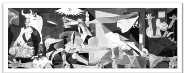
¿O más bien tu casa parece el GUERNICA?(5)

(1) Joven de la Perla, J. Vermeer (1665-67)