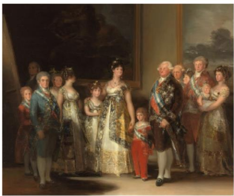
Y tu FAMILIA, ¿ es como la de CARLOS IV?(4)

Participa y ¡déjanos ver tus dotes de caracterización!